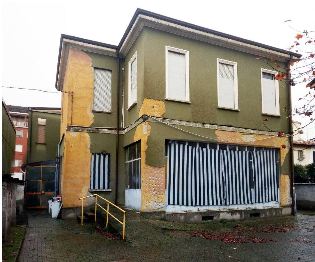
6. Facciata posteriore nordovest.