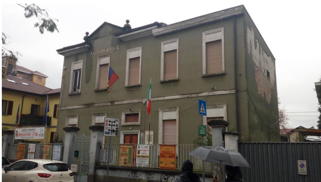
2. Facciata principale vista nordest.