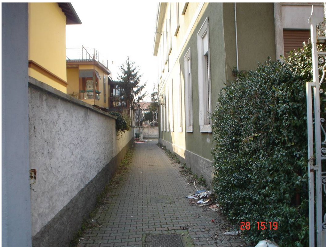
3. Ingresso cortile.