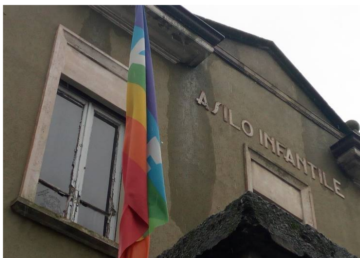
4. Particolari di serramenti e cornicioni in facciata est.