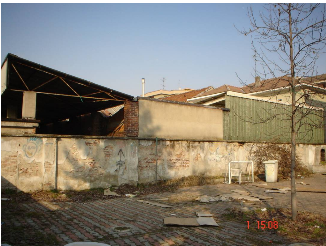
9. Cortile muro nord