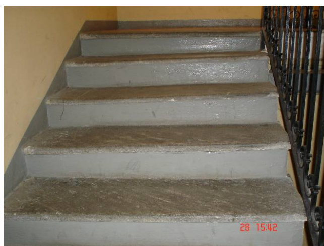
14. Particolare dei gradini dissestati della prima rampa di scala.