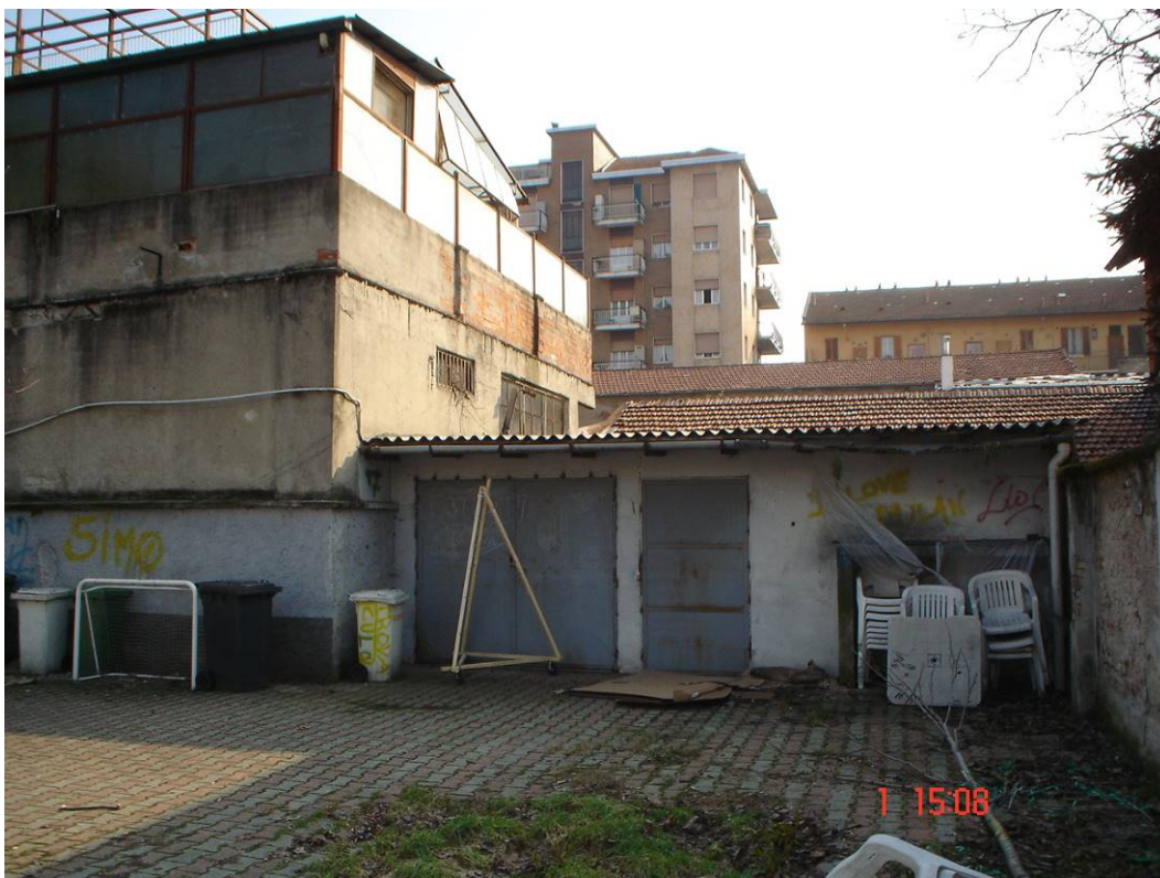
8. Cortile con depositi