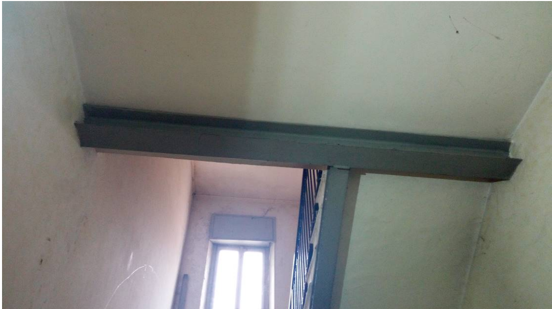
13. Particolare vanno scala