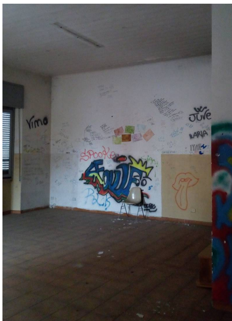
16. Il salone al piano primo.