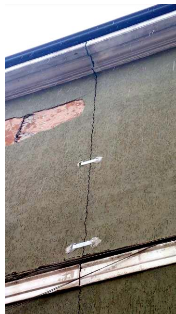
5. Particolare di facciata sud.