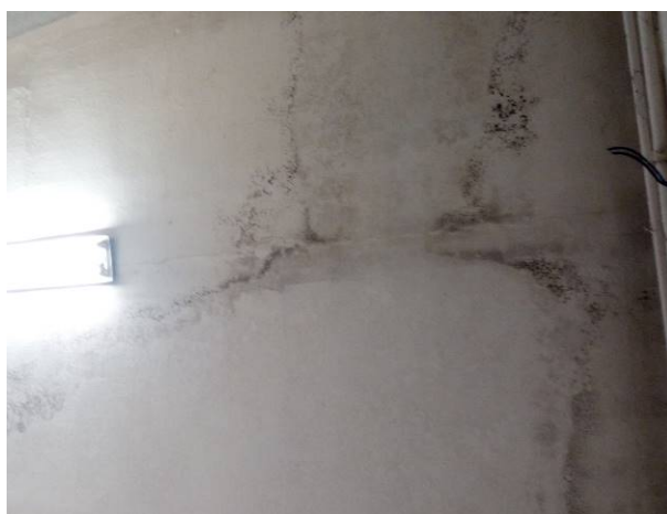
11. Particolare del plafone del corridoio.