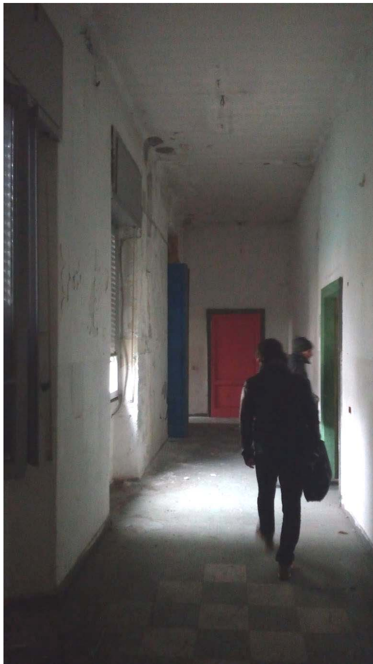
15. Corridoio al piano primo