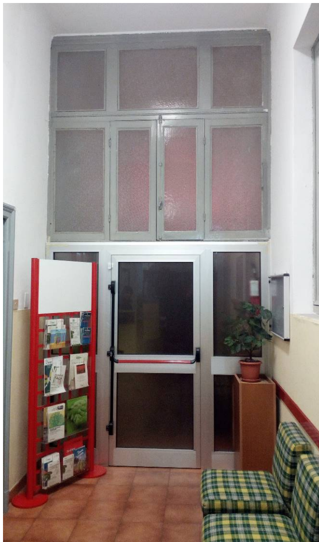
10. Porta ingresso a corridoio piano rialzato.