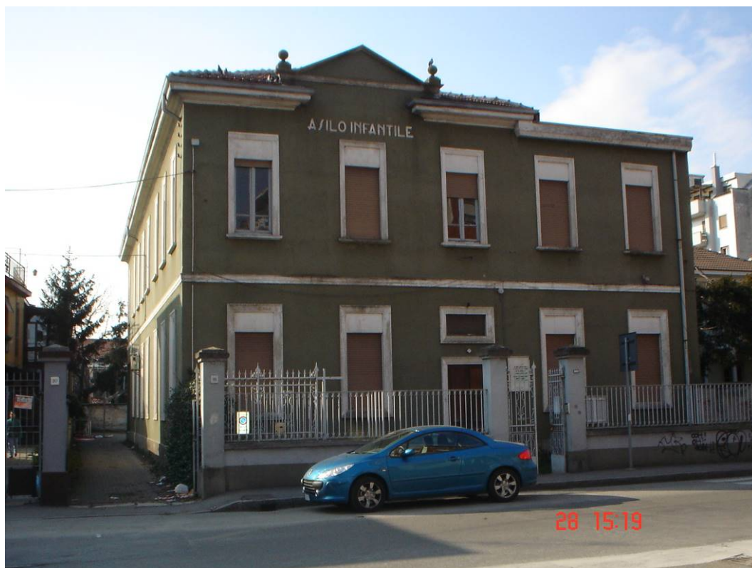
1. Facciata principale vista sud-est.