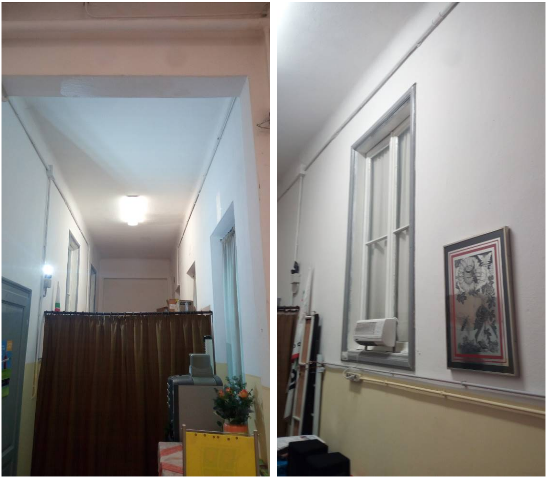
12. Corridoio interno piano rialzato